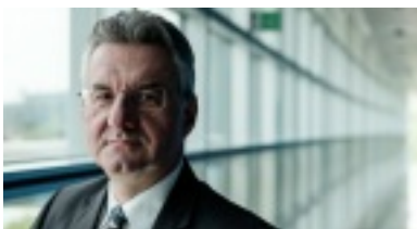
Jan Zahradil.

Jan Zahradil (Demokratische Bürgerpartei, Tschechische Republik) wurde am 14. November zum Spitzenkandidaten seiner Partei ernannt.