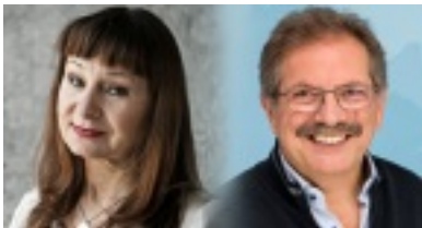
Violeta Tomic und Nico Cue, Spitzenkandidierende der Europäischen Linke.