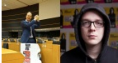
Martin Sonneborn, Nico Semsrott.

Die PARTEI zog mit dem Spitzenduo Martin Sonneborn und Nico Semsrott in den Europawahlkampf 2019. Sonneborn saß bereits seit fünf Jahren in Brüssel. Zusammen mit dem Kabarettist Nico Semsrott mochte er die PARTEI 2019 erneut ins Europaparlament führen.