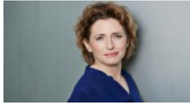
Nicola Beer Generalsekretärin der FDP.

Nicola Beer ( https://www.nicola-beer.de/ ) wurde auf dem Europaparteitag der Liberalen in Berlin mit 86 Prozent der abgegebenen Stimmen zur Spitzenkandidatin der FDP gewählt und führte damit den Europawahlkampf der Partei an. Sie sprach sich auf dem Parteitag für eine Erneuerung der Europäischen Union aus.