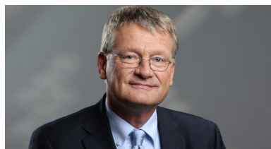
Prof. Dr. Jörg Meuthen.

Prof. Dr. Jörg Meuthen ist Bundessprecher der AfD und seit 2017 Mitglied im Europaparlament. Für die Europawahl 2019 zog Meuthen als Spitzenkandidat der AfD in den Wahlkampf.