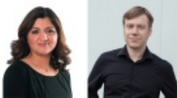
Özlem Alev Demirel, Martin Schirdewan.

Die Linke ging mit einem verhältnismäßig jungen Spitzenduo ins Rennen: Özlem Alev Demirel ist 34 Jahre alt und aus Nordrhein-Westfalen; Martin Schirdewan, 43, kommt aus Berlin. zur Pressemitteilung ( https://www.die-linke.de/start/presse/detail/spitzenduo-fuer-die-europawahl-2019/ )