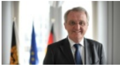
Rainer Wieland.

Rainer Wieland, aktueller Vizepräsident des Europäischen Parlaments, steht auf Platz eins der Landesliste der baden-württembergischen CDU.