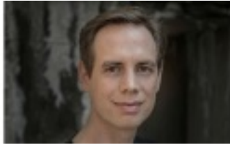
Patrick Breyer.

Patrick Breyer ist seit 2006 Mitglied bei den Piraten. Er war fünf Jahre als Abgeordneter und Fraktionsvorsitzender für die Piraten im Landtag Schleswig-Holstein vertreten und trat nun als Spitzenkandidat bei der Europawahl 2019 an.