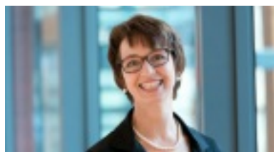
Ulrike Müller.

Ulrike Müller vertrat die Freien Wähler seit 2014 im Europäischen Parlament. Sie gehörte der Fraktion ALDE an (Allianz der Liberalen und Demokraten für Europa ( /fraktionen-eu-parlament#c21226 )).