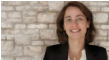
Katarina Barley.

Die bisherige Bundesjustizministerin Katarina Barley war die Spitzenkandidatin der SPD für die Europawahl. Die SPD-Spitze hatte sie offiziell im Mai 2018 nominiert. Barley blieb bis zur Europawahl im Mai 2019 als Justizministerin im Amt und wechselte danach nach Brüssel in das Europäische Parlament.