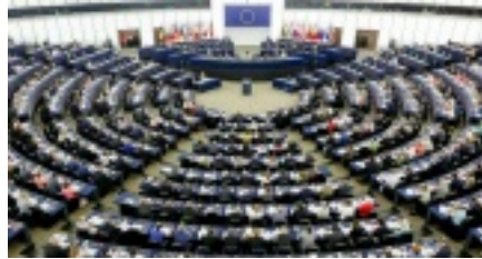
Blick ins Europäische Parlament