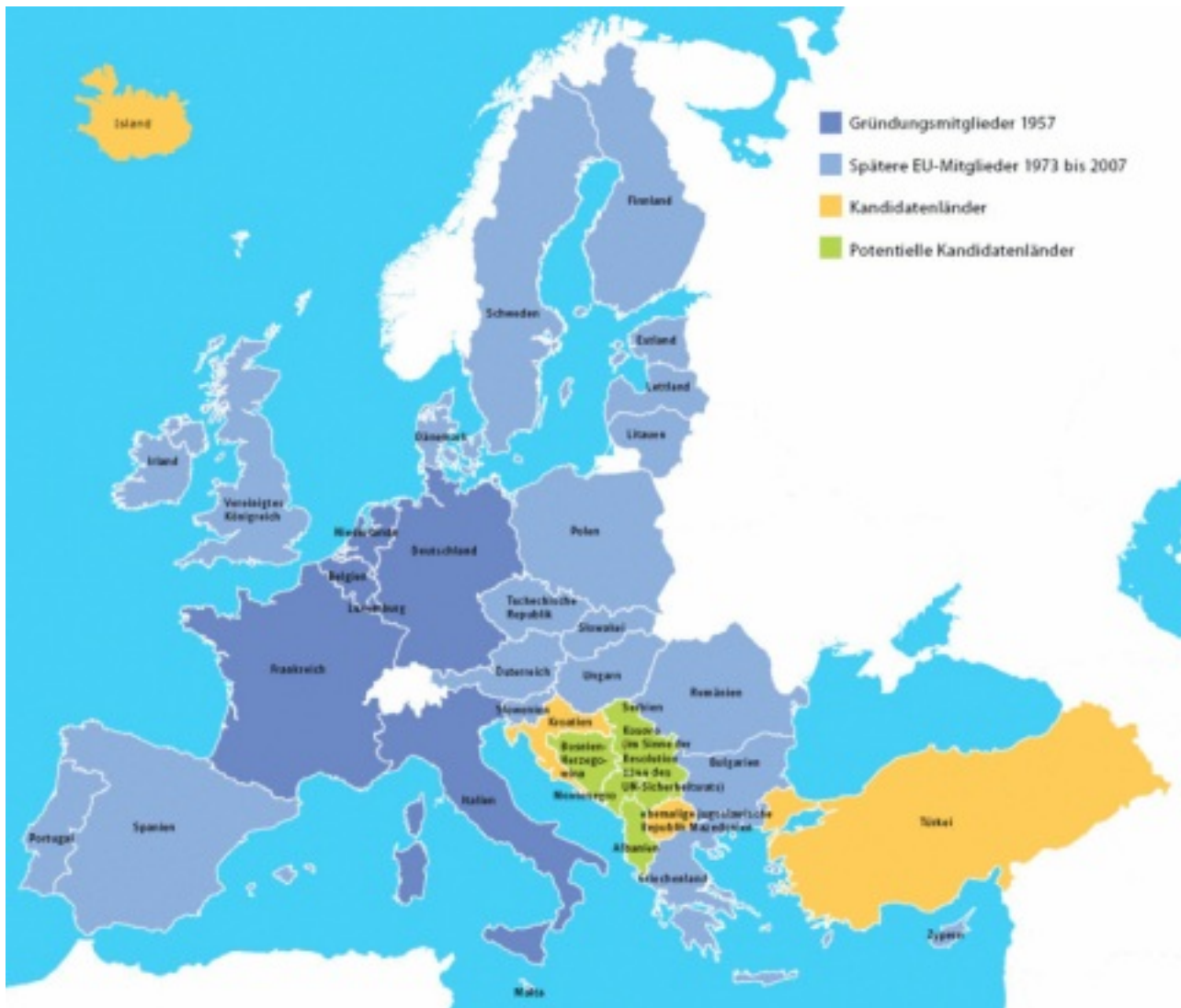
Karte der Erweiterung der EU, Mitgliedsstaaten, Beitritts- u. Bewerberkandidaten