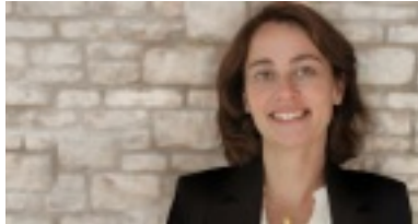
Katarina Barley.

Die bisherige Bundesjustizministerin Katarina Barley war die Spitzenkandidatin der SPD für die Europawahl. Die SPD-Spitze hatte sie offiziell im Mai 2018 nominiert. Barley blieb bis zur Europawahl im Mai 2019 als Justizministerin im Amt und wechselte danach nach Brüssel in das Europäische Parlament.