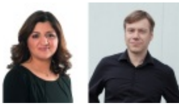
Özlem Alev Demirel, Martin Schirdewan.

Die Linke ging mit einem verhältnismäßig jungen Spitzenduo ins Rennen: Özlem Alev Demirel ist 34 Jahre alt und aus Nordrhein-Westfalen; Martin Schirdewan, 43, kommt aus Berlin.