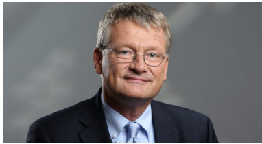
Prof. Dr. Jörg Meuthen.

Prof. Dr. Jörg Meuthen ist Bundessprecher der AfD und seit 2017 Mitglied im Europaparlament. Für die Europawahl 2019 zog Meuthen als Spitzenkandidat der AfD in den Wahlkampf.