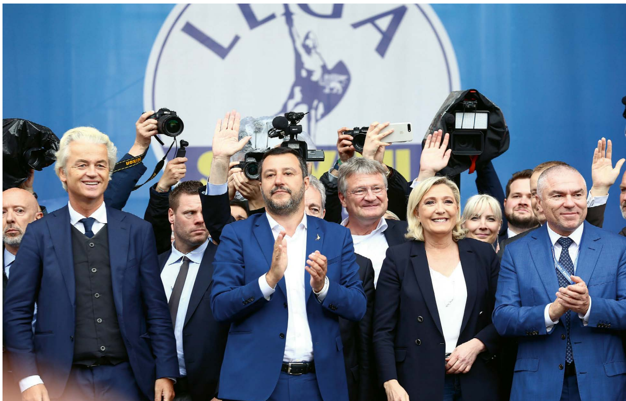
Gemeinsamer Auftritt europäischer Rechtsaußenparteien im Europawahlkampf 2019: In Mailand sind vorne unter anderem Geert Wilders, Matteo Salvini und Marine Le Pen zu sehen. Jörg Meuthen, zum damaligen Zeitpunkt AfD-Parteivorsitzender, steht hinter Salvini und Le Pen.