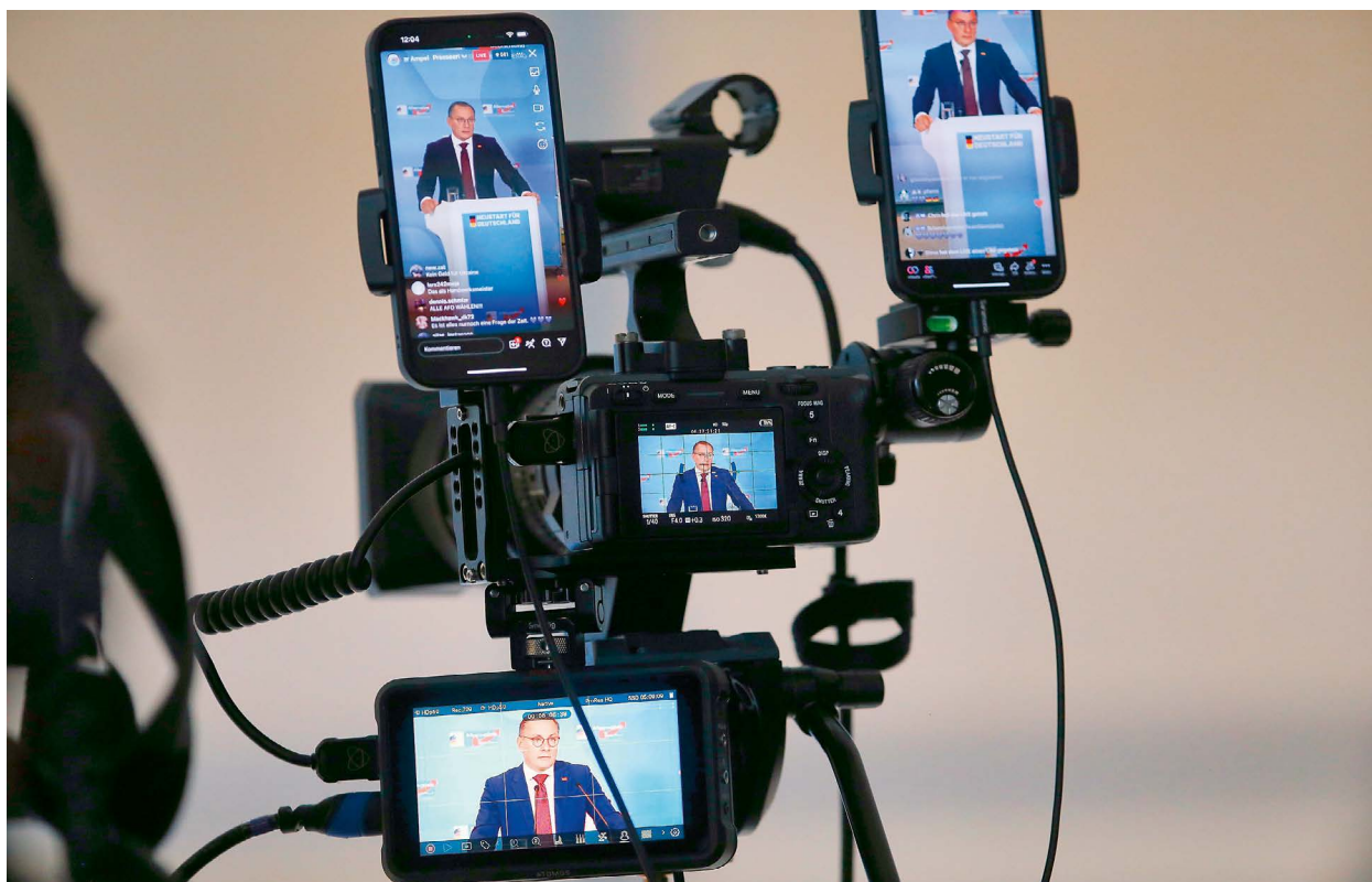
Tino Chrupalla (AfD) gibt vor einer Bundestagssitzung ein Statement ab, das zeitgleich in verschiedene Social-Media-Kanäle ausgespielt wird. Rechtsaußenparteien setzen zunehmend auf digitale Mobilisierung und bauen eigene „alternative“ Medienangebote auf, um ihre Narrative unabhängig von etablierten Medien zu verbreiten.

Rechtsaußenparteien in Europa befinden sich längst nicht mehr im Aufstieg – sie sind angekommen. Als fester Bestandteil vieler nationaler Parteiensysteme, teils sogar in Regierungsverantwortung, prägen sie politische Debatten, setzen Themen und verschieben kontinuierlich die Grenzen des Sagbaren. Ihre Etablierung markiert eine neue Phase, die Cas Mudde (2019) als „vierte Welle“ der extremen