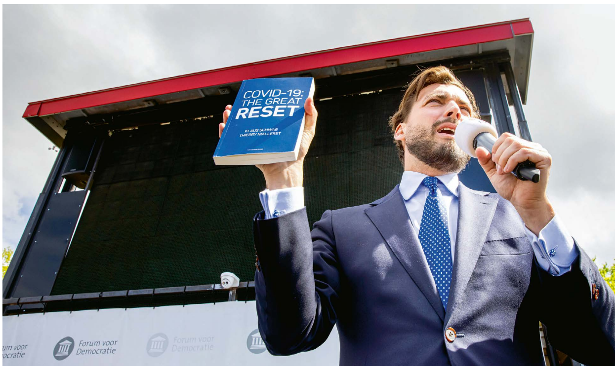
Thierry Baudet, Vorsitzender der niederländischen Partei Forum voor Democratie, bei einer Protestaktion gegen Corona-Maßnahmen im Mai 2021 in Den Haag. Die FvD hatte die staatlichen Beschränkungen scharf kritisiert und dabei auch stark zugespitzte verschwörungsideologische Narrative, etwa zur „Great Reset“-Agenda, aufgegriffen.

und interparteiliche Uneinigkeiten innerhalb dieser politischen Familie. In den Niederlanden etwa betrachtet die PVV Russland zwar als Aggressor, zögert jedoch, militärische und finanzielle Unterstützung für die Ukraine zu leisten. Dagegen stellt Forum voor Democratie (FvD) die Mitgliedschaft in der NATO offen infrage und fordert die Aufhebung der Sanktionen gegenüber Russland. Diese divergierenden Positionen verdeutlichen, dass der Umgang mit Russland und geopolitische Fragen insgesamt zu den zentralen Bruchlinien innerhalb des europäischen Rechtsaußenlagers zählen.